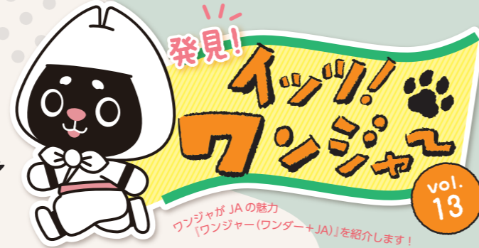
JAえちご中越 公式キャラクター「ワンジャ」

毎日賑わうJA直売所「ただいまーと」 (三条市)の、普段見られない朝の様子を ご案内。人気の秘密を探るんジャ〜!