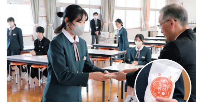
難関突破米を受け取る生徒

JAは、管内の中学校62校の3年生4,139人にオリジナルブランド「難関突破米」を贈りました。2月24日には、柏崎市立南中学校を訪問し「これから立ち向かう難関を突破してほしい」と生徒たちを激励しました。