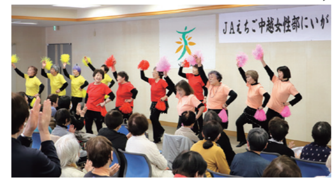
レクダンスを発表する女性部員ら

JA女性部なんかん地域は令和7年度の総会を開きました。部員約100人が出席し、活動の振り返りと次年度の計画を確認。後半ではレクダンスの発表や、脳トレレクリエーションで楽しく交流を深めました。