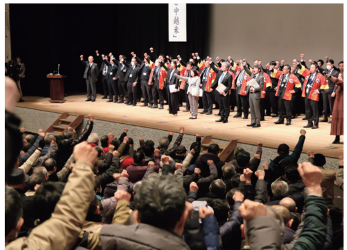
ガンバロー三唱で士気を高める参加者

随意契約の備蓄米や外国産米の優先販売、国産米の価格上昇などで、25年産米の販売実績が前年と一昨年を下回ったことを確認。一方で、国産銘柄米を求める声が依然として多いことも共有し、JAは需要に応じた生産で、米の安定供給を目指す方針を示しました。最後は参加者全員がガンバロー三唱で士気を高めました。