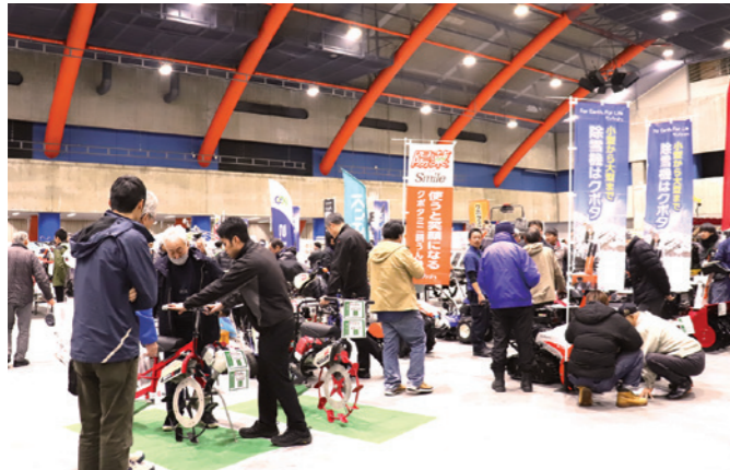
会場のハイブ長岡は大盛況