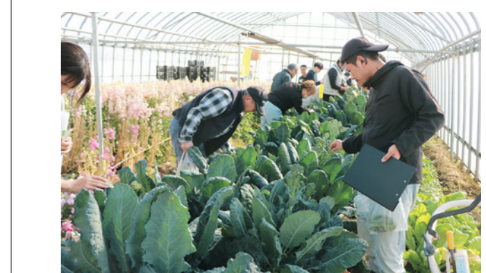
研修会で収穫を体験する出荷者

JA直売所出荷者を対象に、アレッタの栽培研修会を行いました。アレッタはケールとブロッコリーを掛け合わせた野菜で、蕾、茎、葉の全てが食べられます。ブロッコリーに近い味わいで栄養価が高く、サラダや炒め物、揚げ物など幅広く調理できる人気の野菜です。収穫期は12月から3月で、冬でも加温なしでハウス栽培が可能。JAは来期に向け作付け・出荷を勧めています。