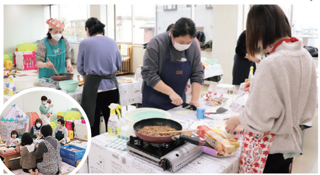
子どもたちはキッズスペースで見守り