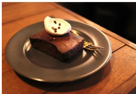
2/18 【お菓子教室】 ショコラテリーヌ