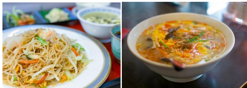
2/4 【中華料理教室】 「五目焼きビーフン」 「酸辣湯」