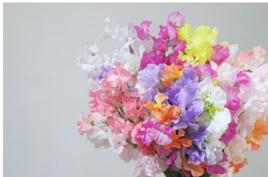
2/12 フラワーアレンジメント教室 スイートピーを使ったアレンジメント