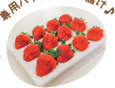
※画像はイメージです(12粒入り)