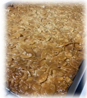
6/30 お菓子教室 フロランタン