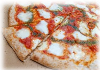
6/7 フランス家庭料理教室 ピザ マルゲリータ