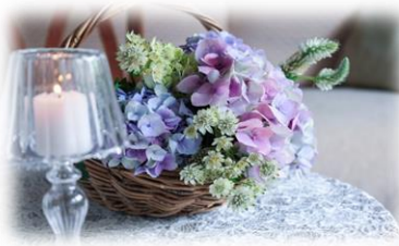
6/22 フラワーアレンジメント教室 アジサイを使った アレンジメント