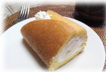
6/15 お菓子教室 丸ごとバナナ