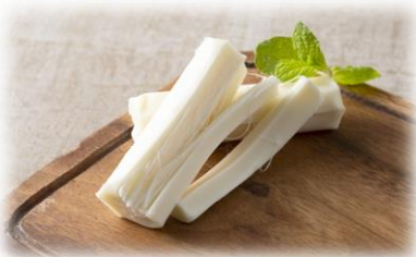
6/8 発酵料理教室 さけるチーズを作ろう