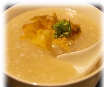
6/17 本格四川料理教室 貝柱入り中華粥 他