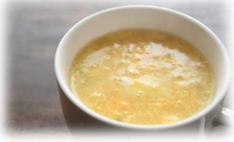
6/18 中華料理教室 豚肉と木耳と卵のピリ辛炒め 中華風コーンスープ