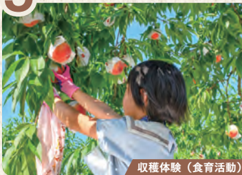
収穫体験(食育活動)