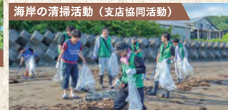
海岸の清掃活動(支店協同活動)