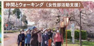
仲間とウォーキング(女性部活動支援)